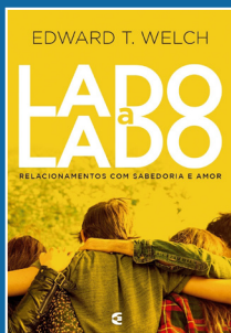
Adolescentes e Jovens