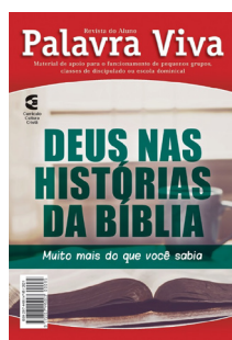
Família da Fé