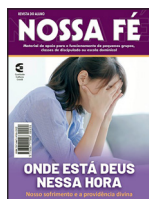
Cultura Contemporânea (no templo)